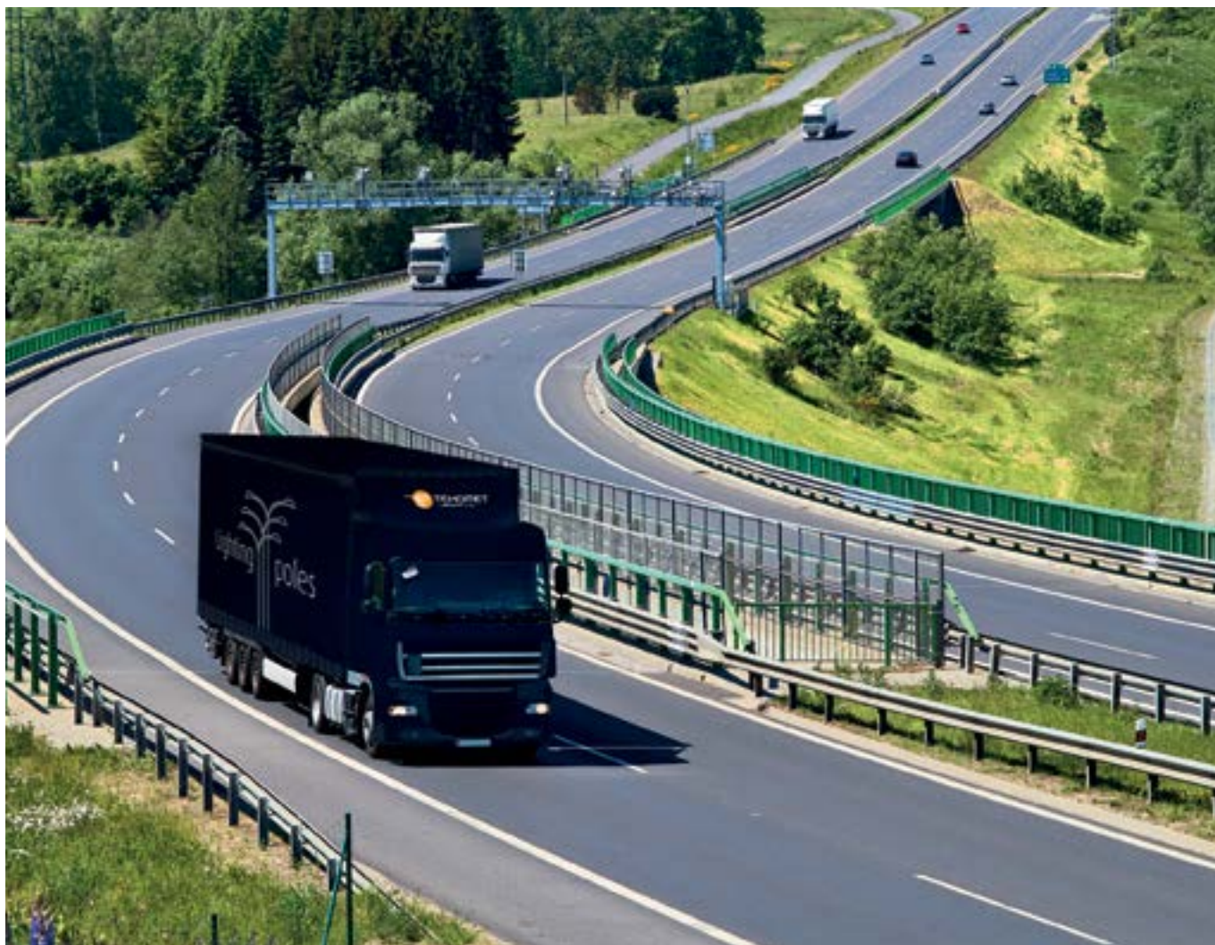
Transport houten masten

Lichtmasten worden in meeste gevallen per vrachtwagen getransporteerd. Vanwege praktische reden verdient het aanbeveling om de nominale mastlengte af te stemmen op de maximale lengte van het transport (vrachtwagen). Zeker als de lichtmasten uit het buitenland komen kunnen de transportkosten aanzienlijk zijn als uitgeschoven opleggers gebruikt dienen te worden.