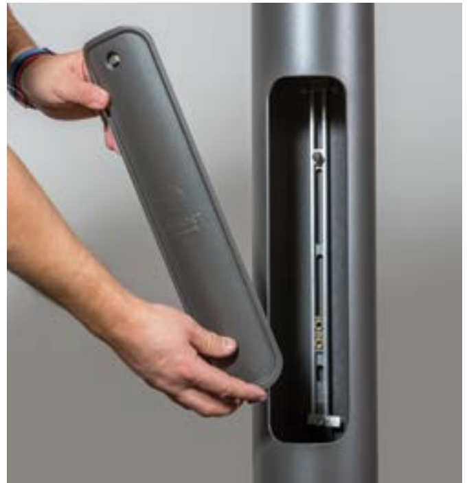
Voorbeeld inrichting mastcompartment

Belangrijk detail hierbij is de aarding van de lichtmast. Het metalendeel van de lichtmast dient geaard te worden omdat dit deel bij een defect onder (elektrische) spanning kan komen te staan. Het aarden van het stalen mastdeel dient te geschieden door middel van een apart aan te brengen aardingsvoorziening zoals beschreven in de NEN-EN 40-2 en NEN1010.