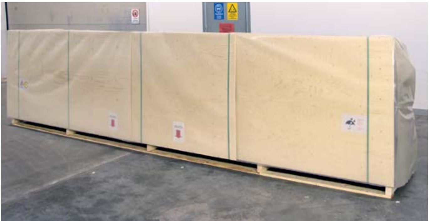
Inpakken voor transport

In de meeste gevallen wordt het geheel als laatste ingepakt met inpakplastic en voorzien van verzend labels.