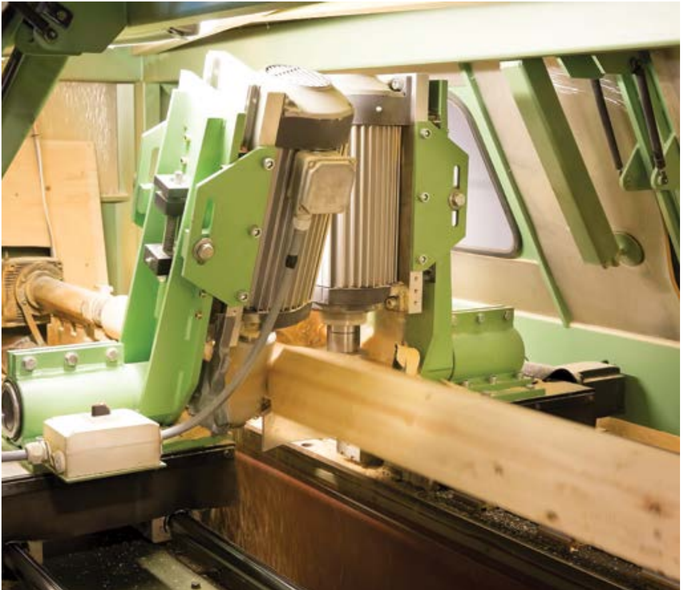
Productie houten mast (draaibank)

Omdat bij toepassing van lijm in een donkere kleur een zwarte streep zichtbaar is over de lengte richting van de mast wordt geadviseerd om een transparante danwel witte lijmsort toe te passen.