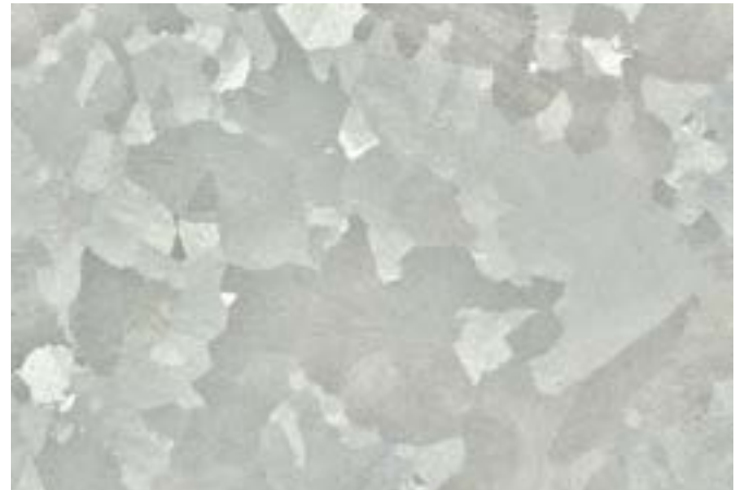
Verzinkt oppervlak staal

In onderstaande paragrafen wordt ingegaan op het voorkomen van roest, het aanbrengen van een kleur en het herstellen van beschadigde coating op stalen delen van lichtmasten.