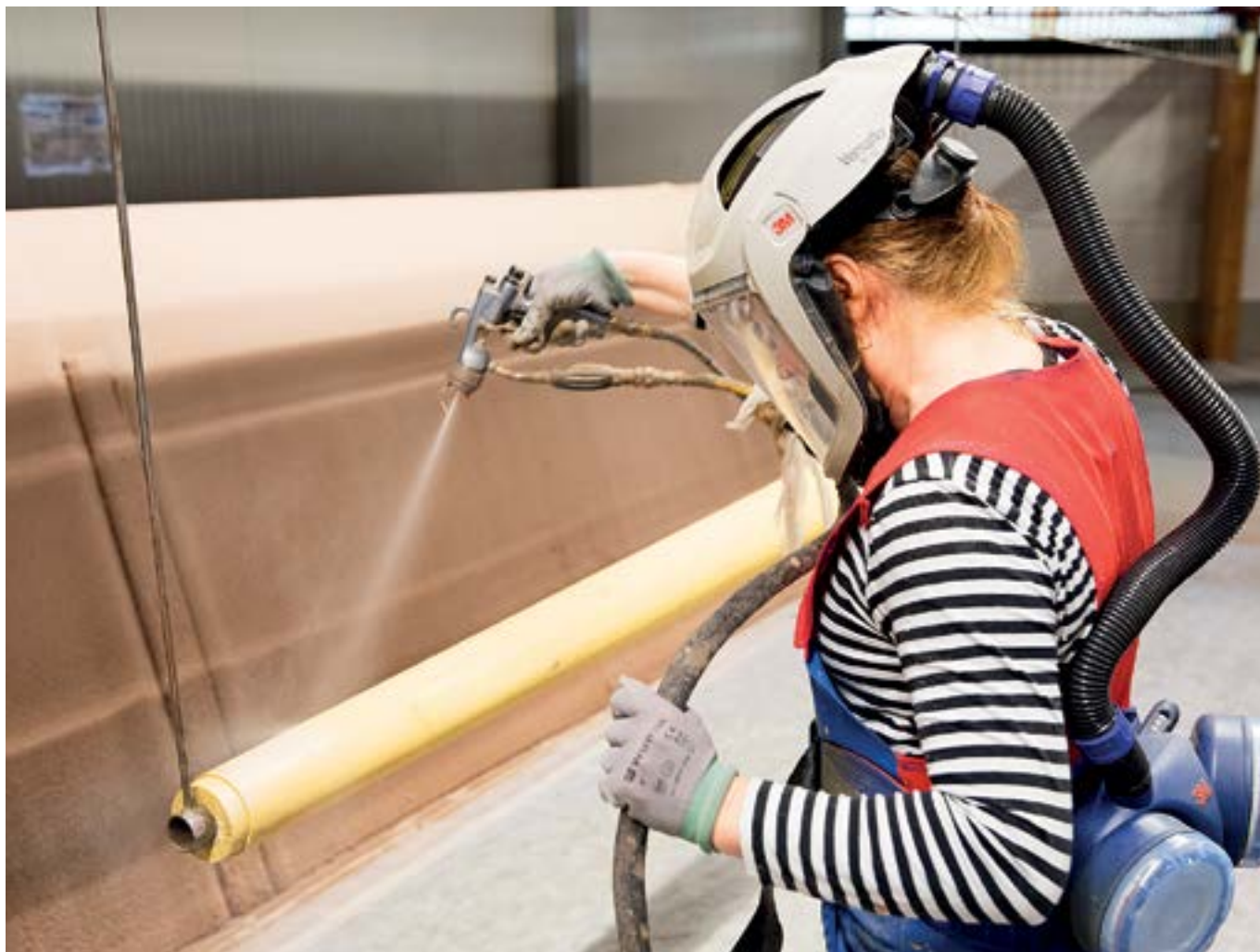
Coaten houten mastdeel

Naar verwachting zal de Europese regelgeving in nabije toekomst verdere eisen stellen aan het toepassen van water gedragen coatings en maximale VOG waarden voor toepassing in buitenruimten.