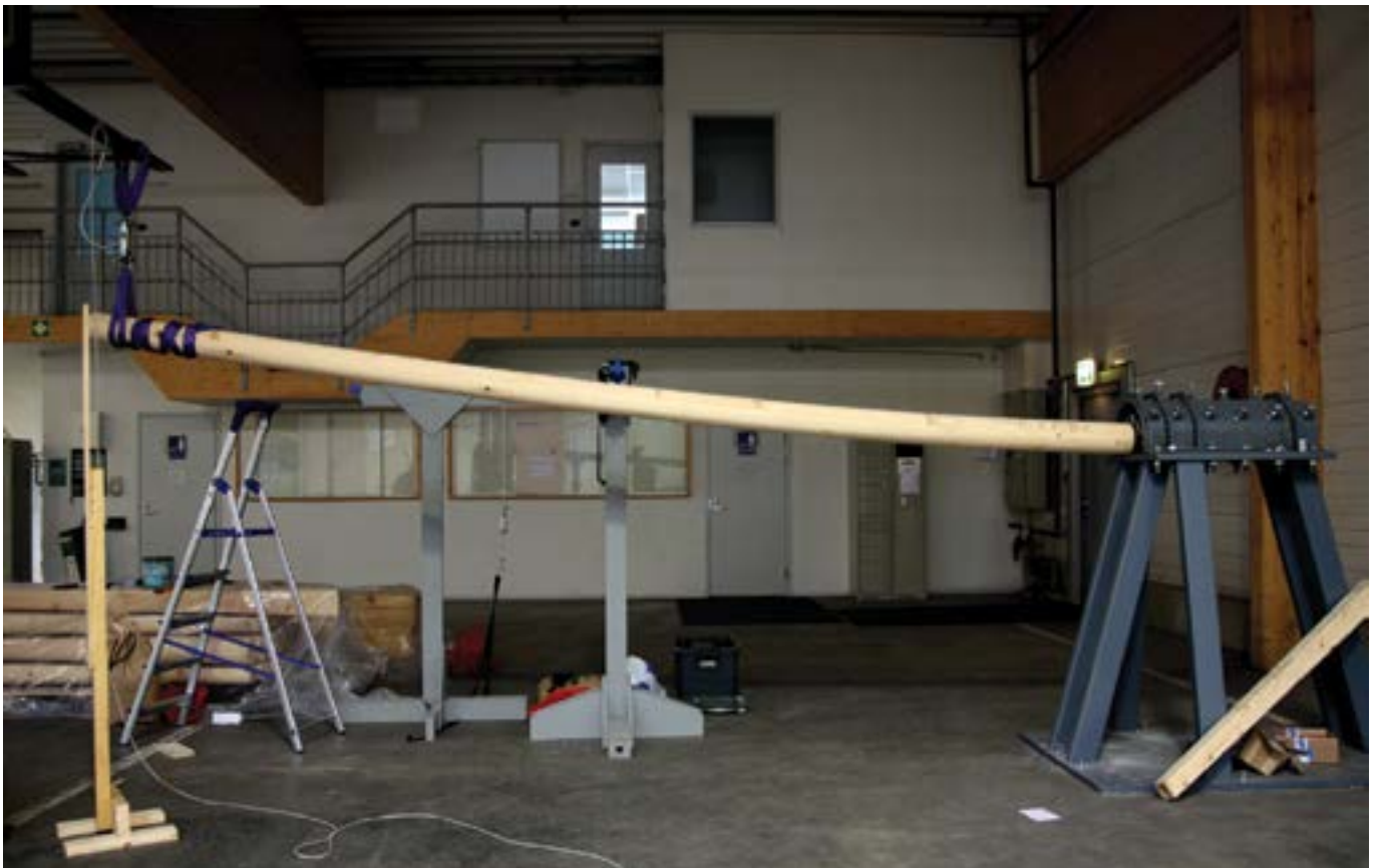
Sterkte test houten lichtmast

Binnen de norm EN 40-3-3, tabel 1 word overigens uitgegaan van een factor 1,2 of 1,4 afhankelijk van gehanteerde uitgangspunten.