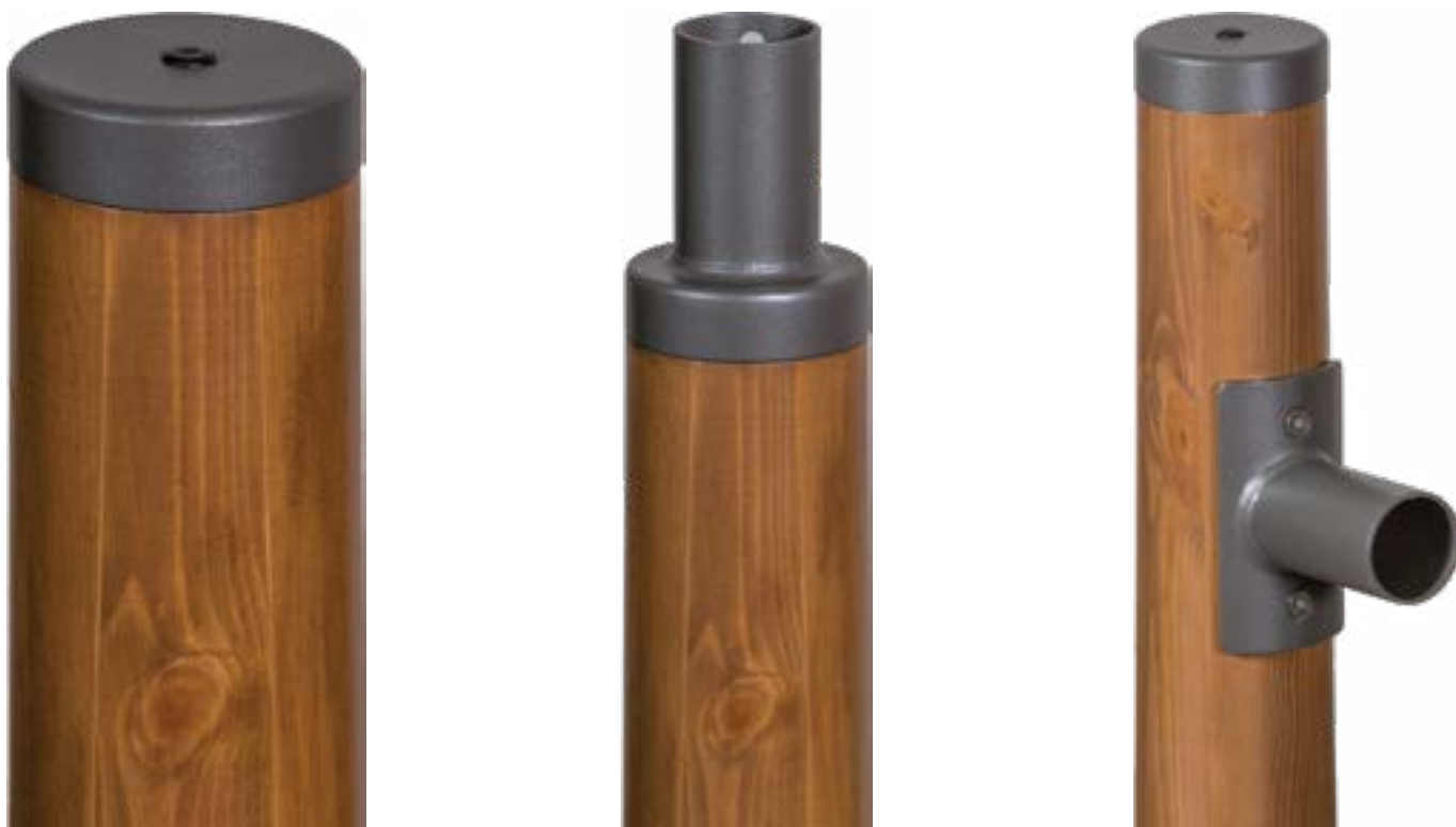
Plaatsing afwerking, armatuurdrager en uithouder op houten mast (voorbeeld)

Om dit te voorkomen kan besloten worden metalen montagevoorzieningen op het houten mastdeel aan te brengen die gebruikt kunnen worden voor de montage van betreffende spots/armaturen. Tevens wordt op deze wijze een sterkere verbinding gerealiseerd. Om het aanbrengen van aansluitleidingen mogelijk te maken verdient het de aanbeveling om aansluitleidingen aan te laten brengen tijdens productie van de lichtmast.