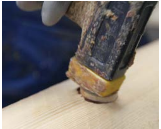
Uitboren kwast en aanbrengen houten plug